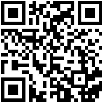
Ausstellung Virtuelle Eröffnung 'RAW Phototriennale Worpswede 2020' Neuer Worpsweder Kunstverein e.V. 20:17 Minuten https://www.youtube.com/watch?v=2OAOl-isUmE

ruhig am Steuer stehen, weil die nächste halbe Stunde vor dem Schöpfen wieder segeln dran ist. Kurs halten. Und Sie stehen dort, hören unten das Wasser sprudeln und gluckern im Rumpf, bewahren die Ruhe und bleiben auf Kurs. Und denken darüber nach, wie man das Loch behelfsmäßig flicken kann. Lassen ein imaginäres Ideenfließband an sich vorbeilaufen, auf dem Lösungen stehen. Und sie scannen in Gedanken mit Ihrer unternehmerischen Intuition die vorbeifahrenden Lösungsobjekte auf Funktion ab. Den Blick in die Weite, das Ruder in der Hand, die Segel straff – bei voller Gelassenheit und Souveränität. Absolute Ruhe im Drama. Die einzige Chance, die es gibt. So ist das. Und im schlimmsten Fall ist das Boot weg, und Sie können immer noch schwimmen. Und Sie überlegen wie lange.