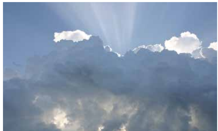
Zwiesprache mit Gott

Ein Neubaugebiet. Saubere Häuser, unerledigte Einfahrten. Ideenfreie Gebäude ohne solaren Dachbelag. Neues von gestern. Die Gemeindeausschreibung ebenso ideenlos. Keine Dachausrichtung Süd, fragwürdig, ob Regenwassernutzung verpflichtend